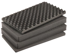
1555AirFS Juego de 4 piezas de espuma de recambio