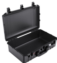
1555NF No Foam