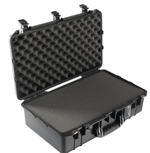
1555WF With Foam