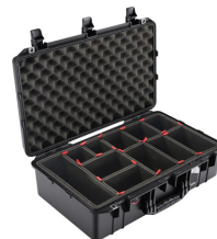
1555TP With TrekPak Divider System