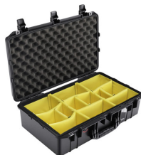
1555WD With Padded Dividers