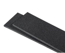
1555TPDIV Extra TrekPak Dividers