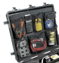
1699 Organizador de tapa