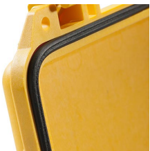
0343 Junta tórica de repuesto