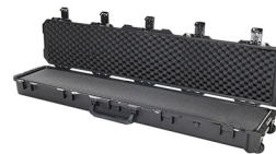
iM3410-X0001 With Foam