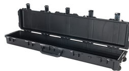
iM3410-X0000 No Foam