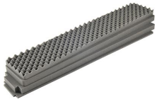
iM3410-FOAM Juego de 4 piezas de espuma de recambio