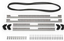
iM2720-BEZEL-LID Marco para instalaciones electrónicas con tapa