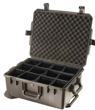
iM2720-X0002 With Padded Dividers