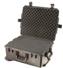
iM2720-X0001 With Foam