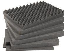
iM2720-FOAM Juego de 5 piezas de espuma de recambio