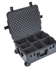
iM2720-X0006 With TrekPak Divider System