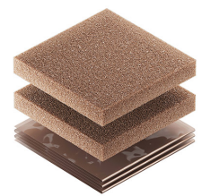
1500CI Corrosion Intercept Kit