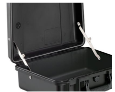
iM-LIDSTAY Soporte de tapa