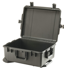
iM2720-X0000 No Foam