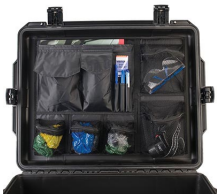
iM27XX-UTILITYORG Organizador de accesorios