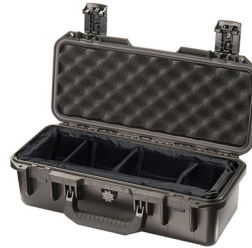
iM2306-X0002 With Padded Dividers