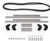
iM2306-BEZEL-LID Marco para instalaciones electrónicas con tapa