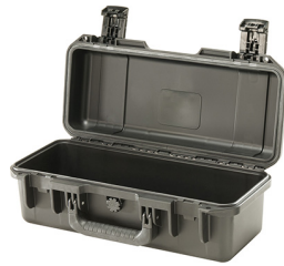
iM2306-X0000 No Foam