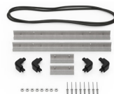
iM2306-BEZEL Kit de bisel para base