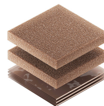
1500CI Corrosion Intercept Kit