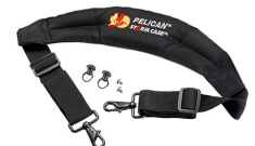
iM-STRAP-S-VER2 Correa para hombro acolchada