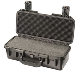
iM2306-X0001 With Foam