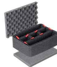
1150TPKIT Kit de séparation de la valise TrekPak