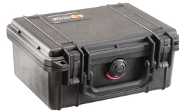
1150NF No Foam