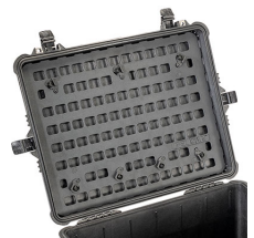
1610MP EZ-Click™ MOLLE Panel