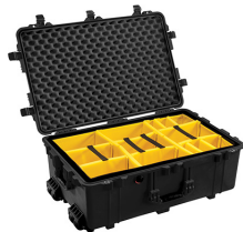
1654 With Padded Dividers