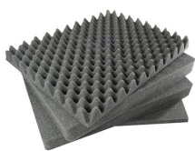
1651 Jeu de mousses de rechange, 4 pièces