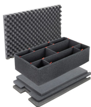
1650TPKIT Kit de séparation de la valise TrekPak