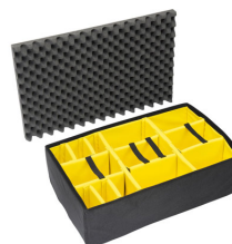
1655 Cloison en mousse