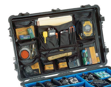
1659 Photo/Pochette couvercle