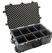
1650TP With TrekPak Divider System