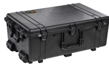
1650NF No Foam