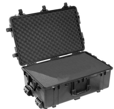
1650WF With Foam