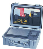
1509 Pochette couvercle