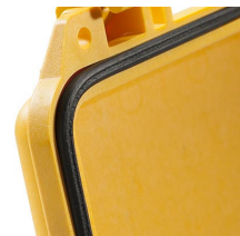
1703 Joint torique de remplacement