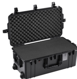
1606WF With Foam