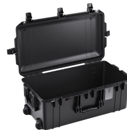
1606NF No Foam