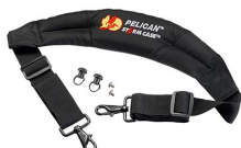
iM-STRAP-S-VER2 Bandoulière rembourrée