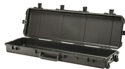
iM3300-X0000 No Foam