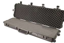
iM3300-X0001 With Foam