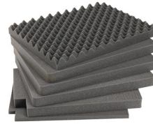
iM2720-FOAM Jeu de mousses de rechange, 5 pièces