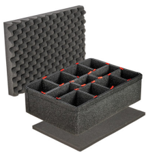
iM2600TPKIT Kit de séparation de la valise TrekPak