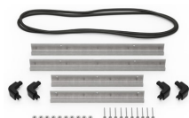
IM2450-BEZEL Support de platine base