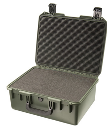
iM2450-X0001 With Foam