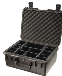
iM2450-X0002 With Padded Dividers