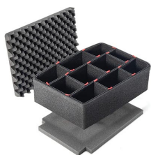
IM2450TPKIT Kit de séparation de la valise TrekPak