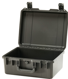
iM2450-X0000 No Foam