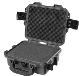
iM2050-X0001 With Foam