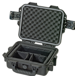
iM2050-X0002 With Padded Dividers