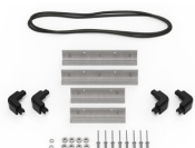
iM20XX-BEZEL Support de platine base