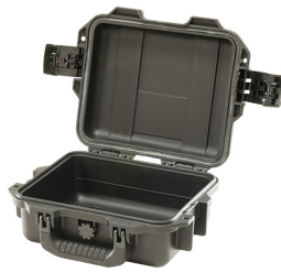
iM2050-X0000 No Foam