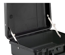
iM-LIDSTAY Compas de couvercle