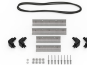
iM20XX-M4-BEZEL Lunette de base (métrique)