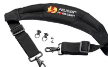
iM-STRAP-S-VER2 Bandoulière rembourrée