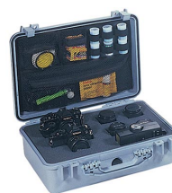
1508 Organizador de tapa para material de fotografía