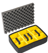
1505 Divisores acolchados