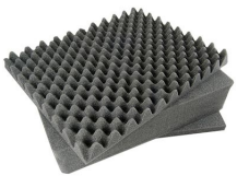
1151 Juego de 3 piezas de espuma de recambio