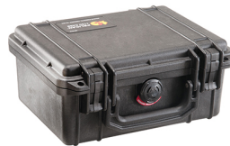
1150NF No Foam