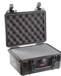
1150WF With Foam