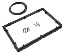
1150PF Panel de adaptación para aplicación especial