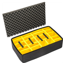
1675 Divisores acolchados