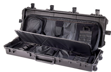
472-PWC-DW3200-BLK-BLK Black Case With Black Soft Case