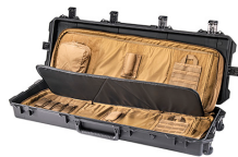
472-PWC-DW3200-BLK-COY Black Case With Coyote Soft Case