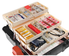
1466 Sistema de bandejas para 1460EMS