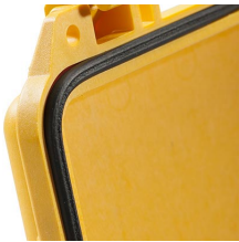
1463 Junta tórica de repuesto