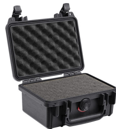
1120WF With Foam