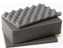
1121 Juego de 3 piezas de espuma de recambio