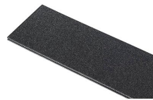
1120TPDIV Extra TrekPak Dividers