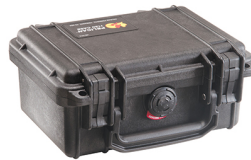
1120NF No Foam