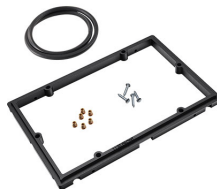
1120PF Panel de adaptación para aplicación especial