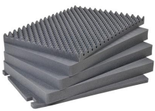
1731 Juego de 5 piezas de espuma de recambio