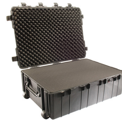
1730WF With Foam