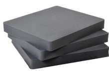
1692 Pick N Pluck™ Sections Only (set of 3)