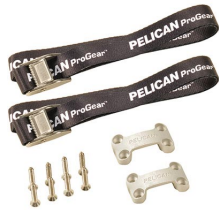
TDKIT Kit de sujeciones