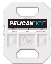
PI-5LB 5lb Ice Pack