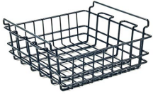
WBSM Cesta de rejilla de secado