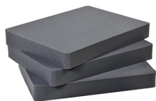
1632 Pick N Pluck™ Sections Only (set of 3)