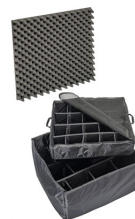
1635 Divisores acolchados