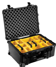
1564 With Padded Dividers