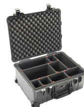
1560TP With TrekPak Divider System