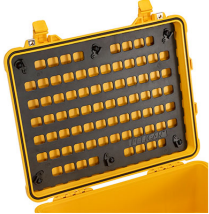
1560MP EZ-Click™ MOLLE Panel