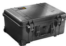
1560NF No Foam