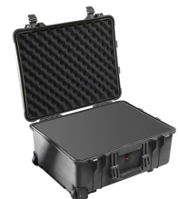
1560WF With Foam