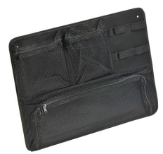
1569 Organizador de tapa