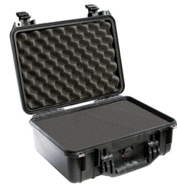
1450WF With Foam