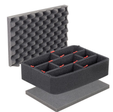
1450TPKIT Kit de divisores TrekPak