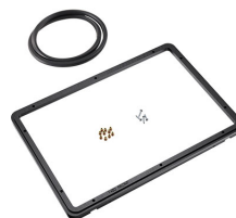
1450PF Panel de adaptación para aplicación especial