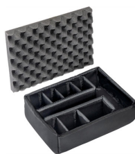
1455 Divisores acolchados