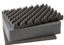
1451 Juego de 3 piezas de espuma de recambio