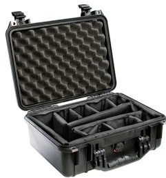
1454 With Padded Dividers