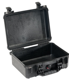
1450NF No Foam