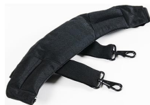
1432 Kit de correas