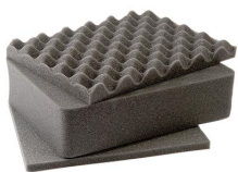
1401 Juego de 3 piezas de espuma de recambio