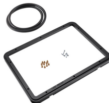
1400PF Panel de adaptación para aplicación especial