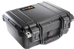
1400NF No Foam