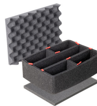
1400TPKIT Kit de divisores TrekPak