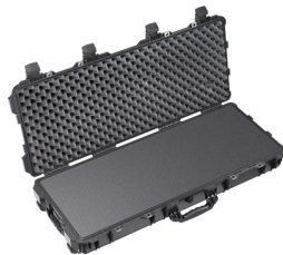
1700WF With Foam