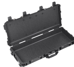
1700NF No Foam