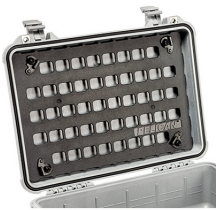
1500MP EZ-Click™ MOLLE Panel