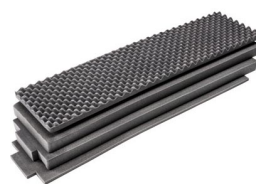
1755AirFS Juego de 4 piezas de espuma de recambio