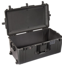
1646NF No Foam