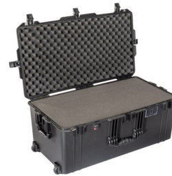
1646WF With Foam