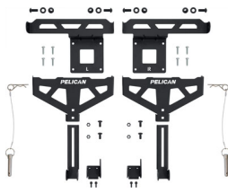
XBEDMT001C Cross-Bed Mount (Ford BoxLink)