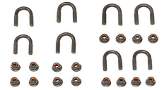
RFMTTC2 Roof Mount Tubular Clamp Kit