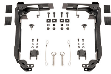
SDDLMT2B Saddle Case Bed Mount Kit for Toyota™ Tacoma™ Truck