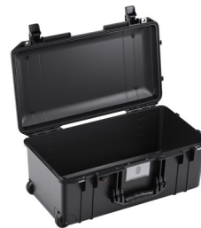
1556NF No Foam