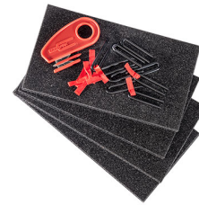
1506TPKIT Kit de divisores TrekPak

Pelican 23215 Early Ave • Torrance, CA 90505 USA • Phone: (310) 326-4700 • (800) 473-5422 • Fax: (310) 326-3311 sales@pelican.com • www.pelican.com