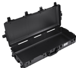
1745NF No Foam