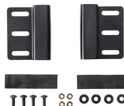
LGMT-001A Air Case Roof Mount