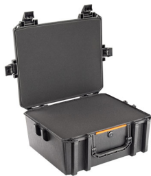
V600WF With Foam