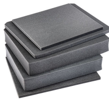
V600FS Juego de 4 piezas de espuma de recambio