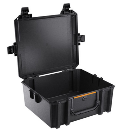
V600NF No Foam