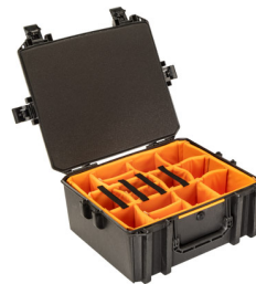
V600WD With Padded Dividers