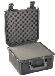
iM2275-X0001 With Foam