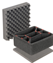
iM2275TPKIT Kit de divisores TrekPak