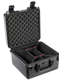
iM2275-X0006 With TrekPak Divider System