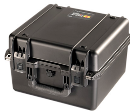
iM2275-X0000 No Foam