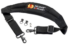
iM-STRAP-S-VER2 Correa para hombro acolchada