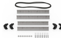
iM2275-BEZEL Kit de bisel para base