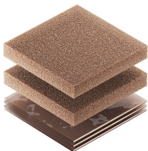
1500CI Corrosion Intercept Kit