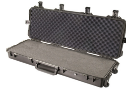
iM3200-X0001 With Foam