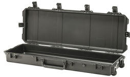
iM3200-X0000 No Foam