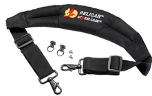
iM-STRAP-S-VER2 Correa para hombro acolchada