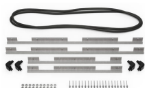
iM3075-BEZEL-LID Marco para instalaciones electrónicas con tapa