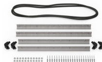
iM2875-BEZEL Kit de bisel para base