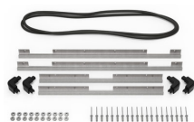
iM2700-BEZEL-LID Marco para instalaciones electrónicas con tapa