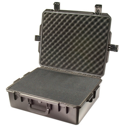
iM2700-X0001 With Foam