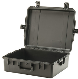
iM2700-X0000 No Foam