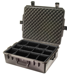
iM2700-X0002 With Padded Dividers