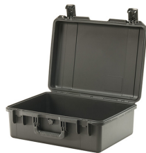
iM2600-X0000 No Foam