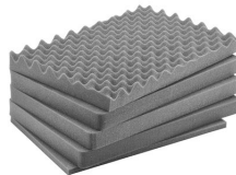
iM2600-FOAM Juego de 5 piezas de espuma de recambio