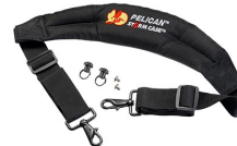
iM-STRAP-S-VER2 Correa para hombro acolchada