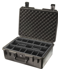
iM2600-X0002 With Padded Dividers