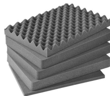
iM2450-FOAM Juego de 5 piezas de espuma de recambio