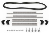
iM2450-BEZEL-LID Marco para instalaciones electrónicas con tapa