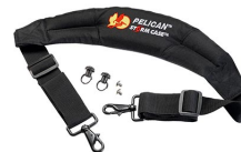
iM-STRAP-S-VER2 Correa para hombro acolchada