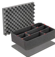
iM2400TPKIT Kit de divisores TrekPak