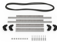
iM2300-BEZEL-LID Marco para instalaciones electrónicas con tapa