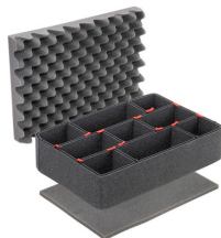
iM2300TPKIT Kit de divisores TrekPak