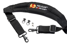
iM-STRAP-S-VER2 Correa para hombro acolchada