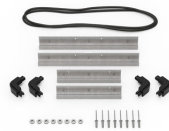
iM2100-BEZEL Kit de bisel para base