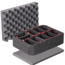
iM2100TPKIT Kit de divisores TrekPak